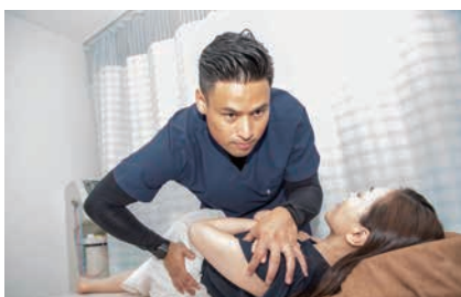
骨盤・姿勢のバランスを確認し、骨格矯正で負担の少ない動きやすい身体へ整えています。