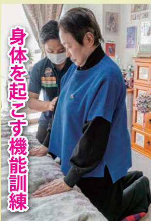
身体を起こす機能訓練

ここで一休み・・・。仕事に戻ろうとは思ったものの、医師からも「しっかりガンと向き合って治療するように」と釘を刺されました(笑)